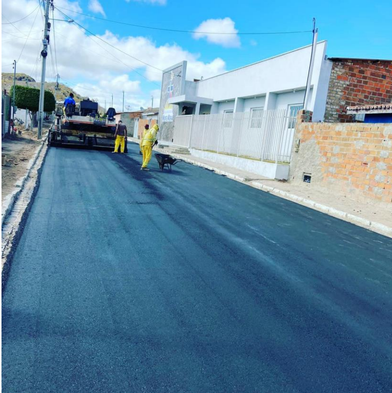
Figura 1 Recapeamento asfáltico na Av. São Paulo e outras