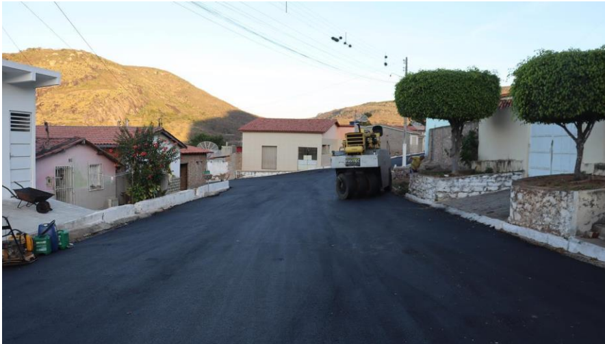
Figura 4- Recapeamento asfáltico na Av. São Paulo e outras