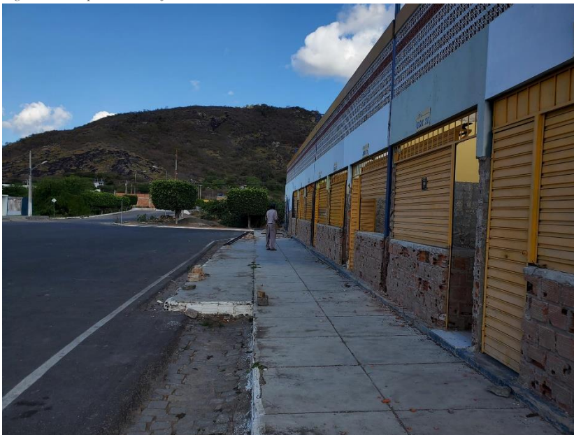
Figura 4- Recapeamento asfáltico na Av. São Paulo e outras