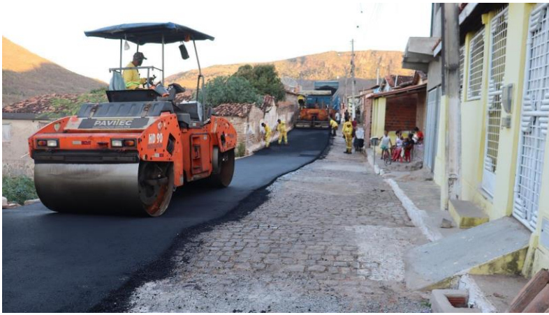
Figura 3 Recapeamento asfáltico na Av. São Paulo e outras