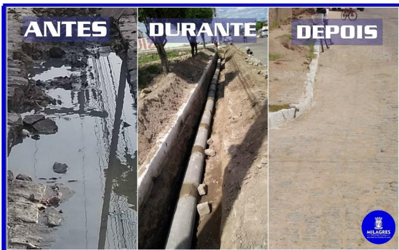
Figura 1 - Recuperação e drenagem de pavimentação