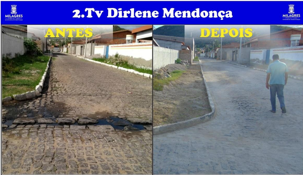
Figura 4 - Recuperação e drenagem de pavimentação