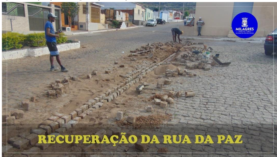
Figura 2 - Recuperação e drenagem de pavimentação