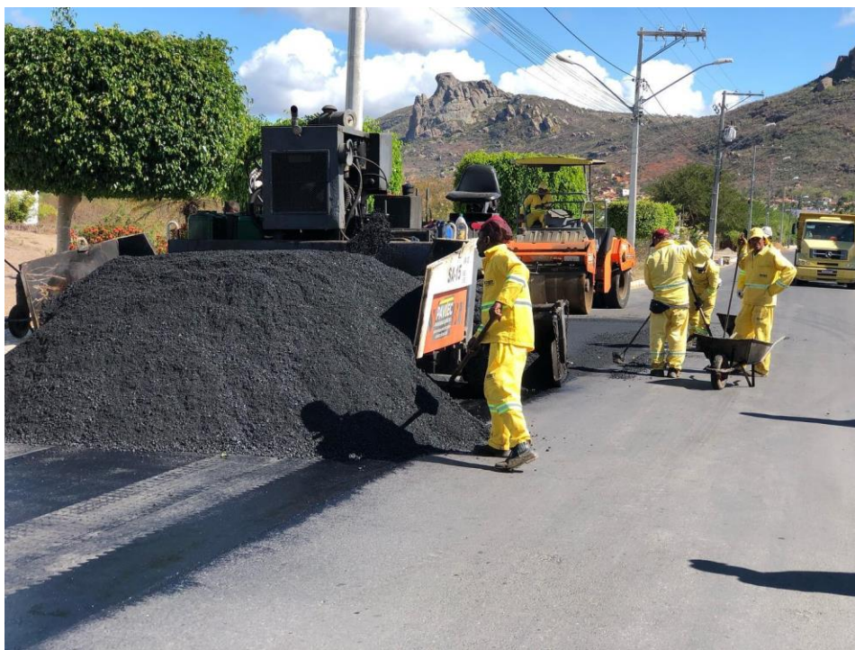
Figura 1- 1ª Recapeamento asfáltico Av. Conrado Menezes