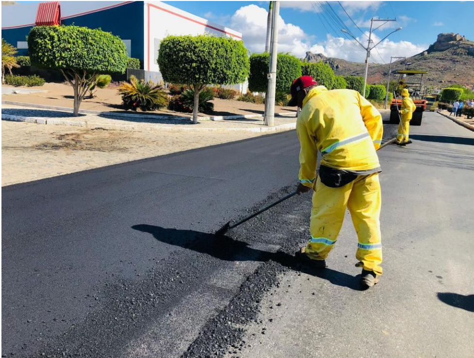
Figura 3-- 1ª Recapeamento asfáltico Av. Conrado Menezes