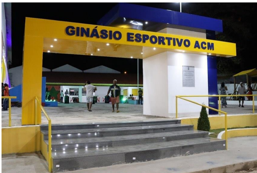
Figura 1- Reforma e ampliação da Quadra do ACM.