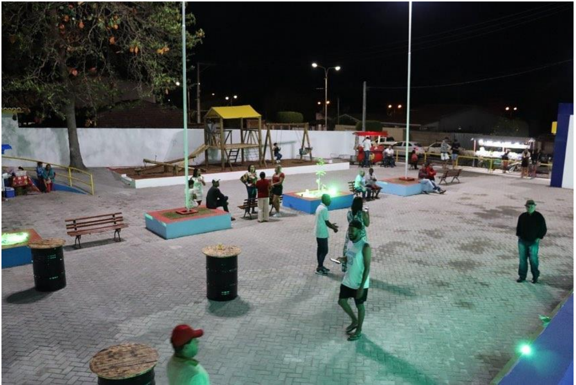
Figura 4 - Reforma e ampliação da Quadra do ACM.