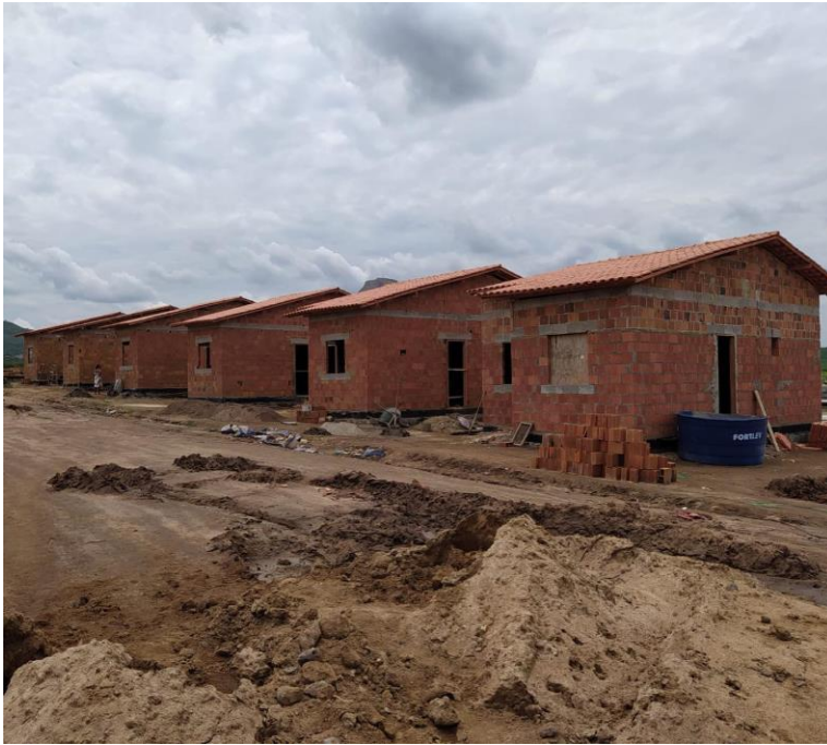
Figura 4- Construção de Unidade Habitacionais