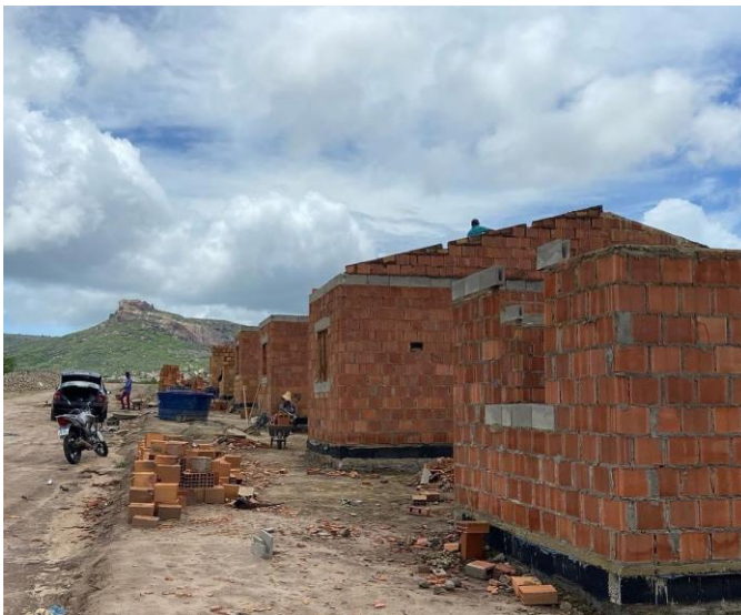
Figura 5- Construção de Unidade Habitacionais