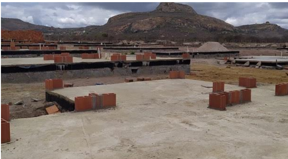
Figura 2- Construção de Unidade Habitacionais