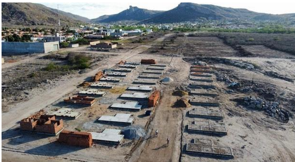
Figura 1- Construção de Unidade Habitacionais