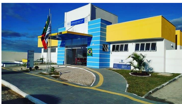
Figura 2- Construção de Unidade Básica de Saúde