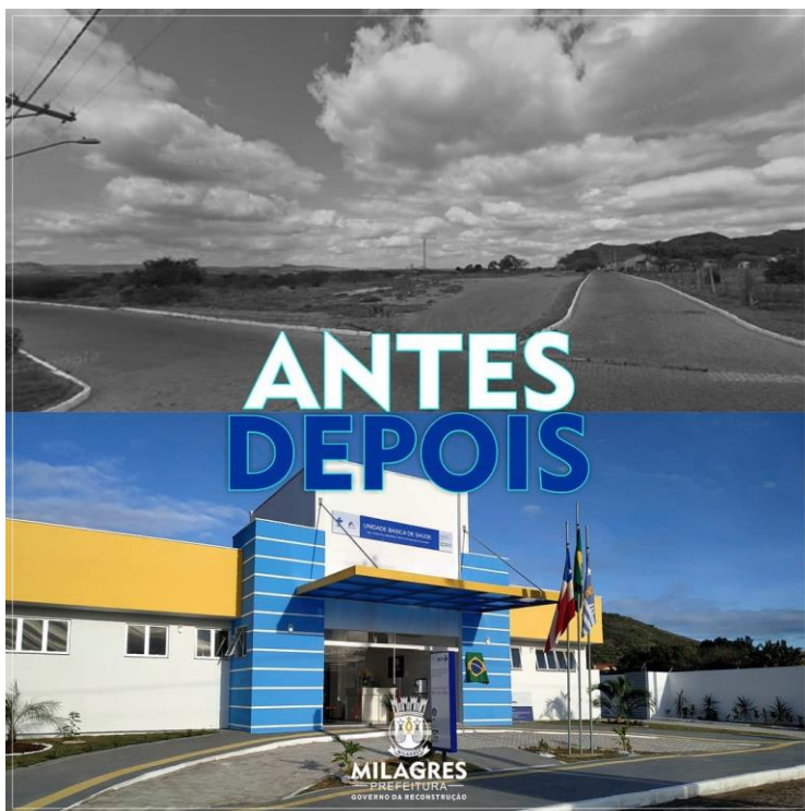
Figura 1- Construção de Unidade Básica de Saúde