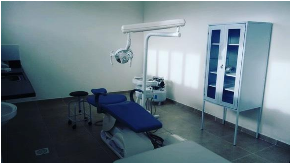
Figura 4- Construção de Unidade Básica de Saúde