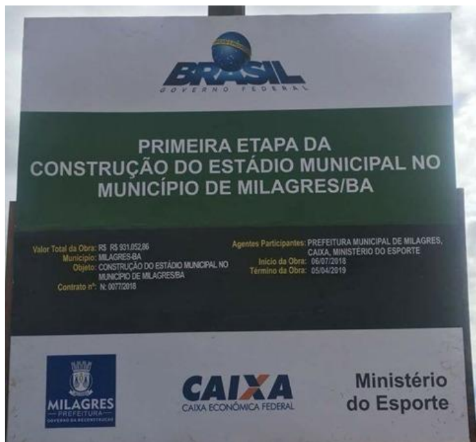
Figura 1 –Estádio Municipal de Milagres/BA.