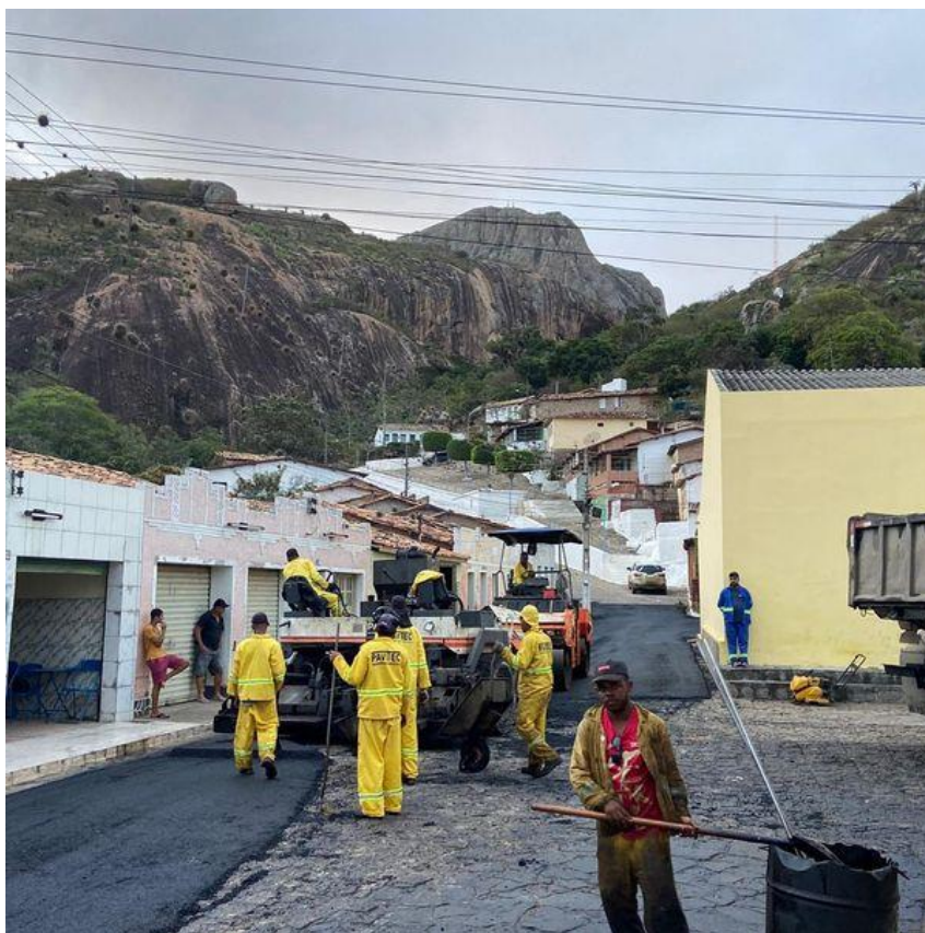
Figura 1 - Recapeamento asfáltico..