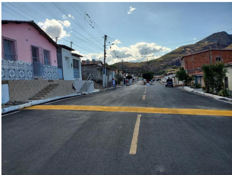
Figura 3 - - Recapeamento asfáltico..