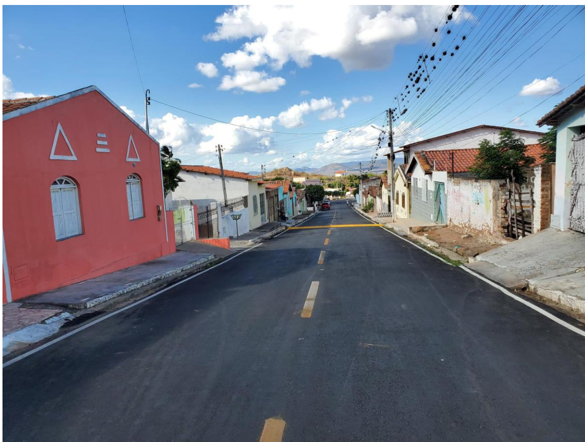
Figura 3 - - Recapeamento asfáltico.