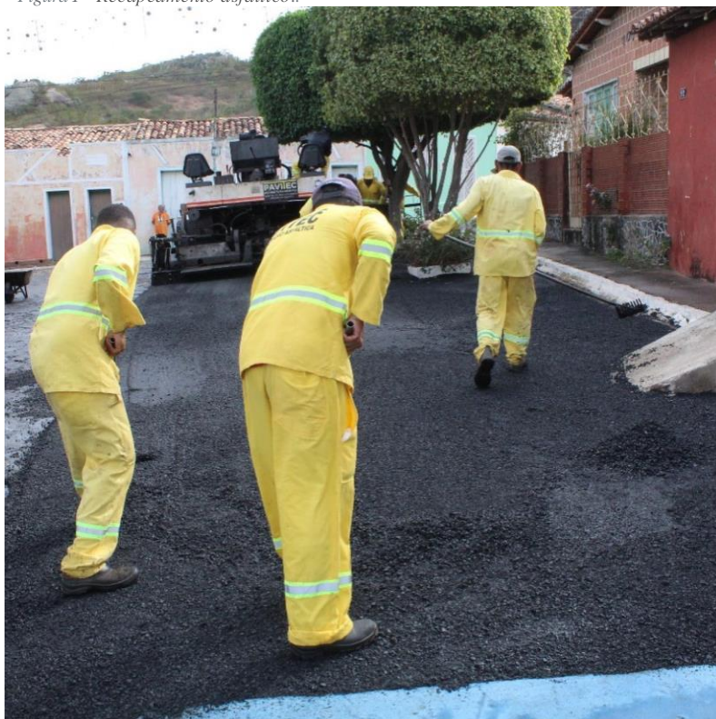
Figura 2 - Recapeamento asfáltico