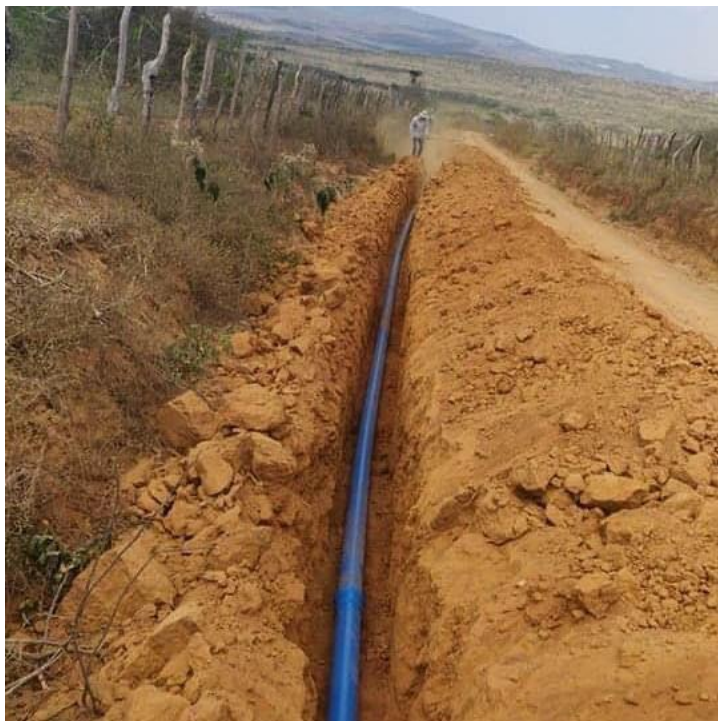
Figura 3 - Construção do sistema integrado de abastecimento de água do Queixo Quebrado