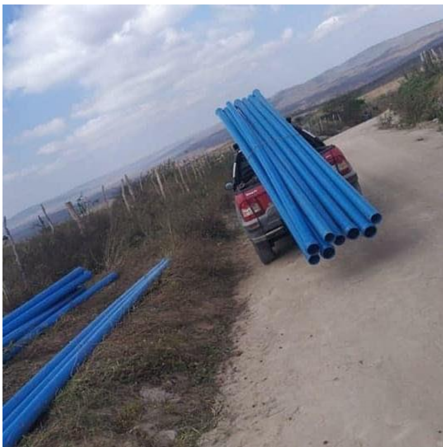
Figura 3 - Construção do sistema integrado de abastecimento de água do Queixo Quebrado.