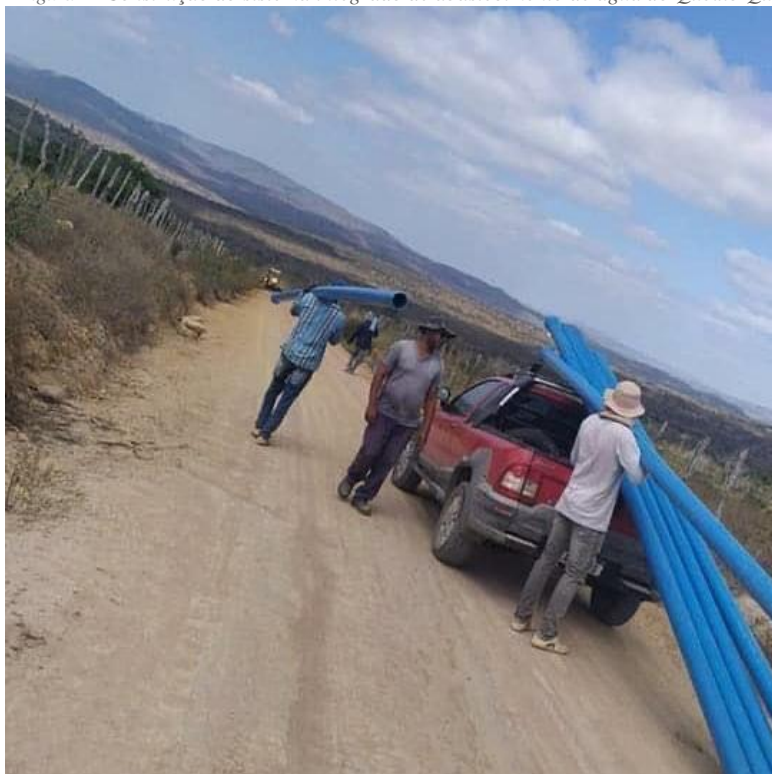
Figura 2 - Construção do sistema integrado de abastecimento de água do Queixo Quebrado