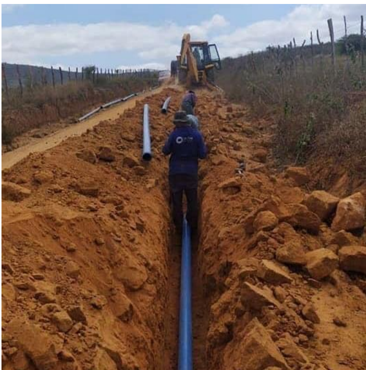
Figura 1 - Construção do sistema integrado de abastecimento de água do Queixo Quebrado..